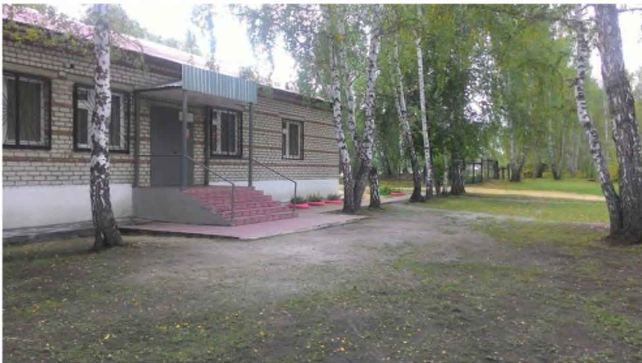
Вход в МКУ ДО "ДЮСШ" со стороны парковки