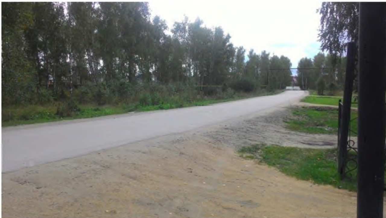
Парковочные места на территории МКУ ДО "ДЮСШ"